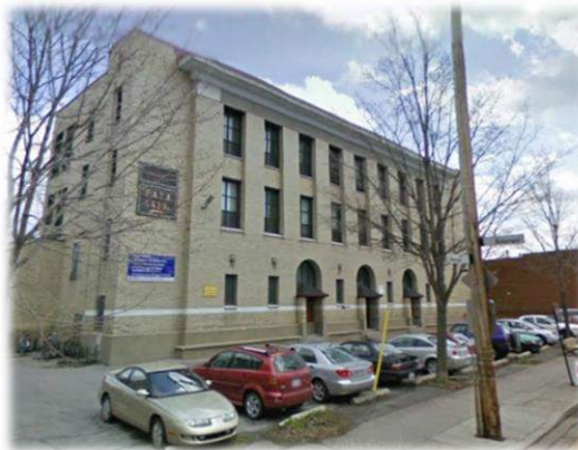
Le 6839 rue Drolet, futur Centre social et communautaire de La Petite-Patrie!

Le coordonnateur du RTCPP est toujours actif dans le dossier d'acquisition du 6839 Drolet. Le projet avance et certains bailleurs ont confirmé leur contribution financière afin que La Petite-Patrie puisse enfin avoir un centre social et communautaire. Malgré tous les défis que cela peut poser, l'option de devenir propriétaire collectivement de l'édifice ouvre des perspectives intéressantes en termes de complémentarité de services et d'enracinement dans la communauté de La Petite-Patrie.